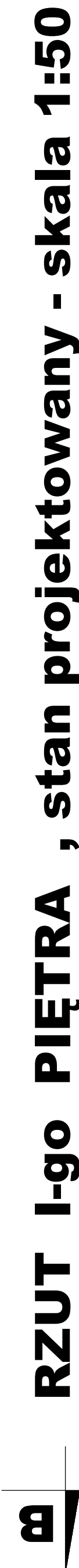
RZUT I-go PIĘTRA , stan projektowany - skala 1:50